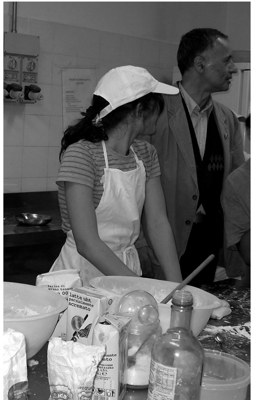
I SEGRETI DELLA PASTA Questa ragazzina potrà chiedere consigli alla nonna